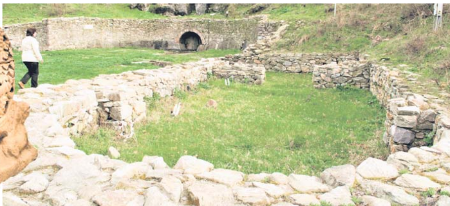
Останки от Светилището на нимфите и Афродита до с. Каснаково