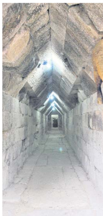
Дромосът (коридорът) на тракийската гробница до с. Мезек