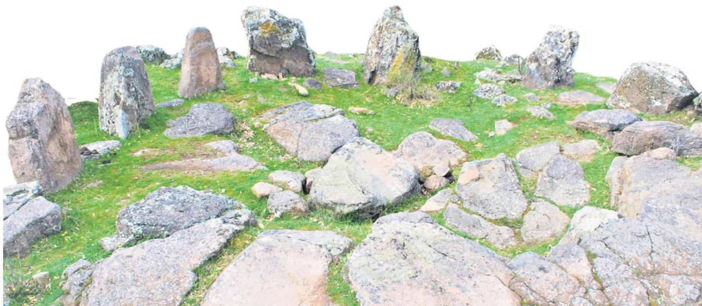
Кромлехът до с. Долни Главанак