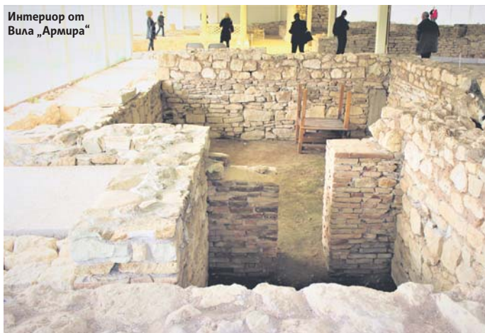
Интериор от Вила „Армира“