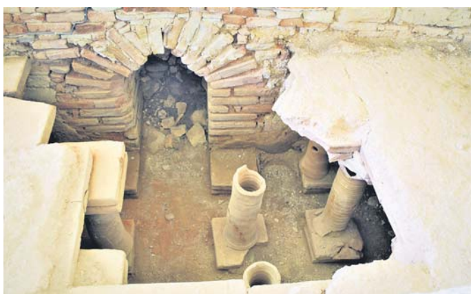
Поговото отопление на Вила „Армира“

централната постройка на цяло именуе от римско време, носеща името си от рекичка, приток на Арда. Именцето се простира върху 2.2 дка, а само жилищната му част покрива към декар. Всъщност помещениата – спалня, трапезария, дневна, кухня, баня и др. формират покрита галерия или вътрешен двор с колонада и басейн. Подът е специално повдигнат и по керамични тръби под него постъпва топъл въздух, произведен от съседна малка, да я наречем котелна, постройка. Очевидно днеш-