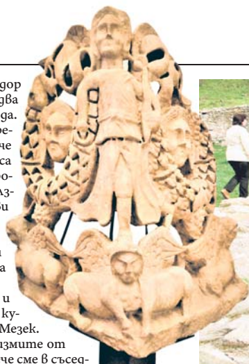
Акротерий от фронтон в Светилището на нимфите и Афродита

Не пропускаме и т.нар. Вила „Армира“ край Ивайловград. Вилата е