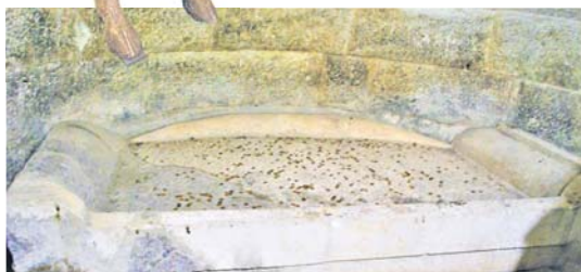
Лежето в тракийската гробница до с. Мезек

Закътани села пазят спомени за жреци, императори и славни битки