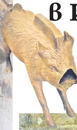
Копие на глигана от гробницата в Мезек, намиращо се в НАИМ